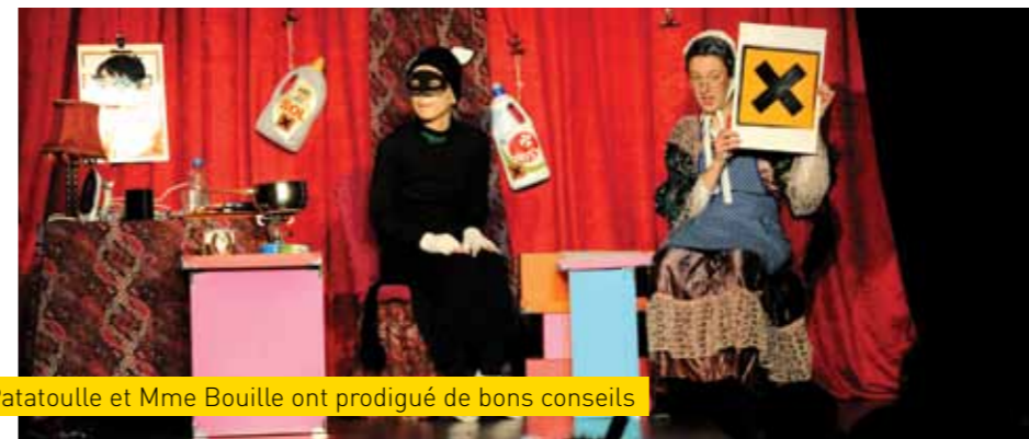
Patatouille et Mme Bouille ont prodigué de bons conseils

de son spectacle destiné aux plus jeunes « Attention Patatouille ». Les aventures du chat Patatouille et de Mme Bouille ont fait découvrir aux spectateurs les nombreux pièges auxquels doivent faire face les enfants. S'ils doivent être prévenus des risques, les parents doivent, eux aussi, faire attention et surtout limiter au maximum les risques potentiels.