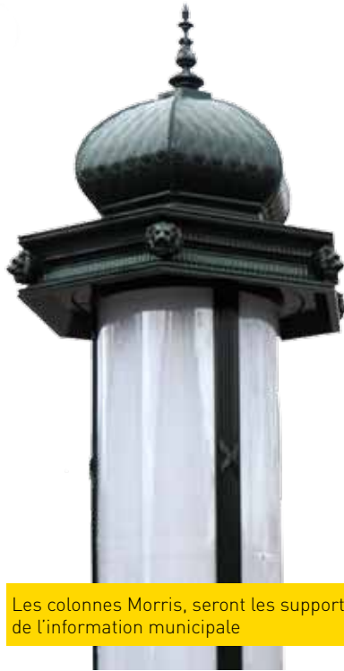
Les colonnes Morris, seront les supports de l'information municipale

Voici quelques semaines, les Émérainvillois ont pu découvrir deux colonnes Morris. Ces colonnes qui afficheront les événements de la Ville seront complétées par des panneaux d'affichage au design plus