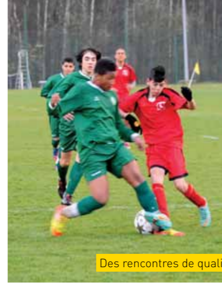
Des rencontres de qualité

Comme l'an passé, le Football Club d'Émerainville a invité à l'occasion des fêtes de Pâques des adversaires coriaces. Des équipes anglaises, nos plus farouches adversaires, à