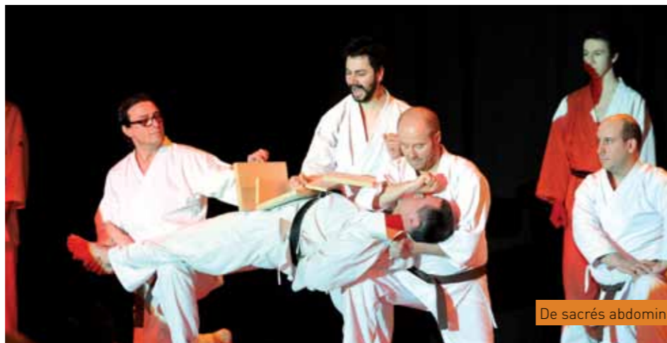
De sacrés abdominaux

public, les athlètes ont enchaîné les figures les plus audacieuses. Aikido, Vovinam, judo, karaté..., les représentants de ces disciplines ont survolé le tatami faisant rêver plus d'un enfant à des exploits digne d'un Teddy Riner. Les karatékas ont clos