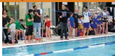
Les encouragements ont fusé des bords du bassin

Jeunes d'Emerainville. Une compétition réservée aux benjamins, poussins et avenirs, qui leur permet de faire leur entrée dans le monde de la compétition.