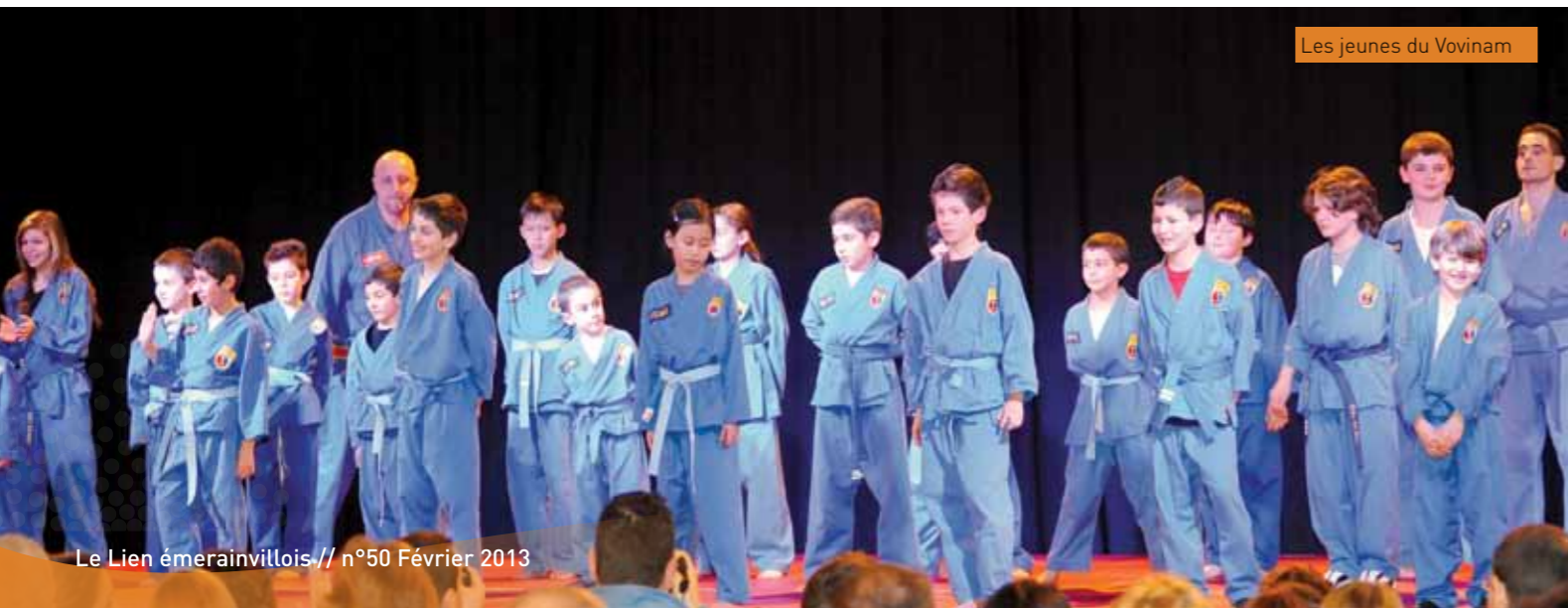
Les jeunes du Vovinam

la soirée en mettant en pièce plaque de bois et parpaings à la seule force de leurs mains. Impressionnant et surtout à ne pas imiter si vous ne voulez pas finir aux urgences d'un hôpital.