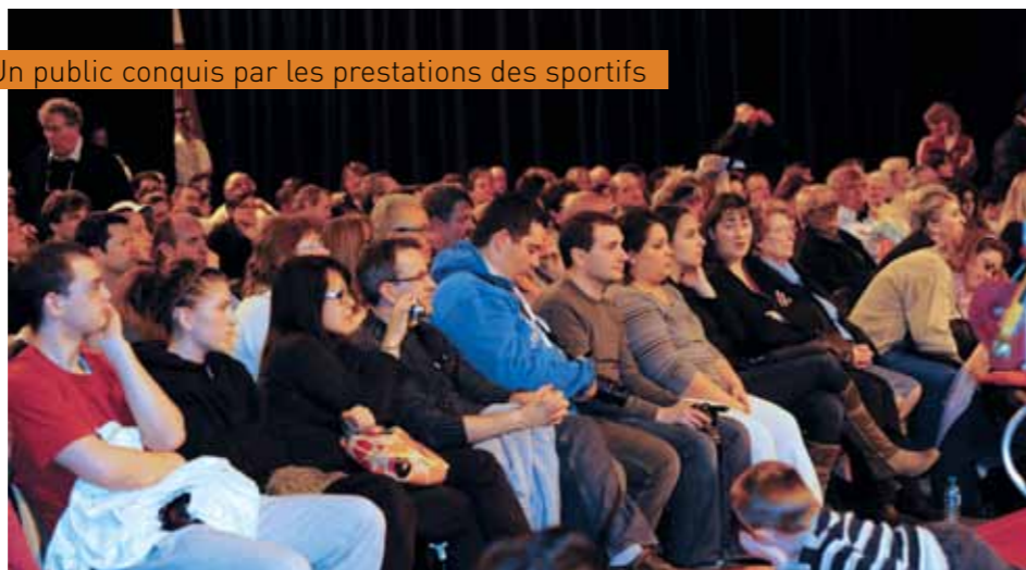
Un public conquis par les prestations des sportifs