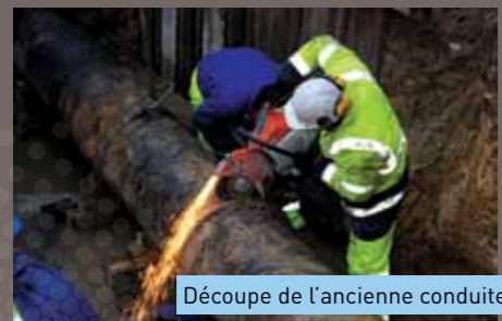
Découpe de l'ancienne conduite

sont pratiquement pas aperçus de la coupure. Ils ont pu prendre leur douche avant d'aller travailler sans imaginer un instant le travail colossal qui a été réalisé dans un temps record.