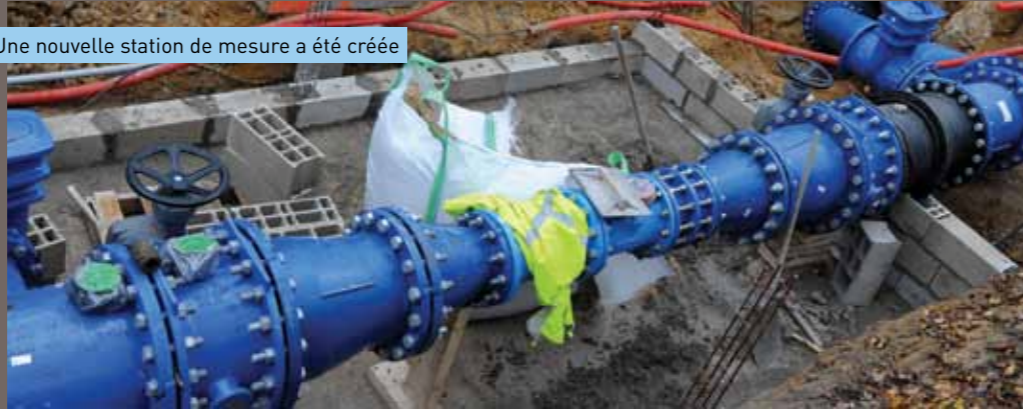
Une nouvelle station de mesure a été créée

recherche de la conduite avant de la faire passer sous la voie rapide. Côté Emerainville, une station de comptage a été réalisée ainsi qu'un raccordement à la conduite.