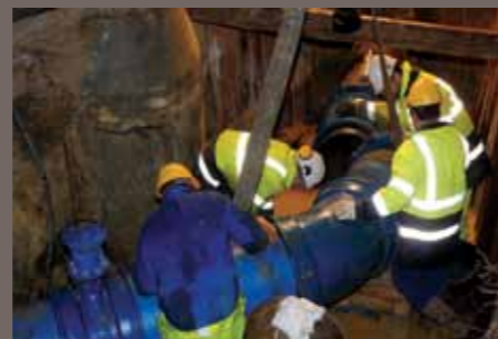
Le moment du raccordement

Cette dernière opération s'est effectuée dans la nuit du 13 au 14 décembre. Il a été tout d'abord nécessaire de purger la conduite incriminée avant que des équipes interviennent. Il a fallu près de 4 heures d'effort côté Emerainville pour mener à bien le travail programmé. Sur Roissy-en-Brie, le travail a été plus délicat et a nécessité plus de temps. Au final, tout s'est achevé dans les temps et les abonnés ne se