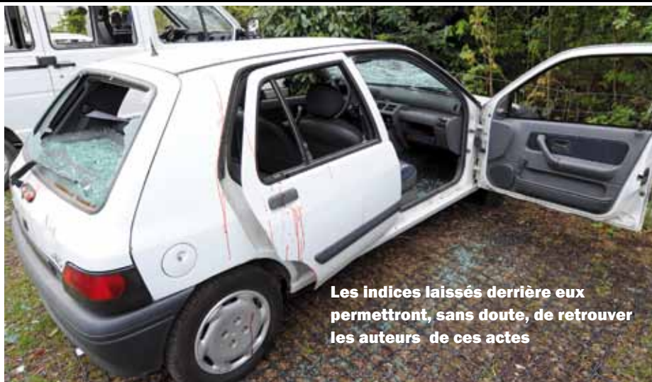
Les indices laissés derrière eux permettront, sans doute, de retrouver les auteurs de ces actes

Des actes incompréhensibles, gratuits qui empêchent les propriétaires des véhicules de se rendre à leur travail. Ils devront, bien entendu, perdre du temps à déposer une plainte au commissariat de police, s'expliquer avec leur assureur, tenter de se faire rembourser... Evidemment le ou les auteurs de ces actes n'en ont cure. Ils se sont amusés à détruire dans le seul but de nuire à autrui sans connaître leurs «cibles». Ce ne sont ni des riches, ni des décideurs mais tout simplement des personnes qui tentent dans un environnement