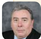
d'Alain KELYOR Maire d'Emerainville