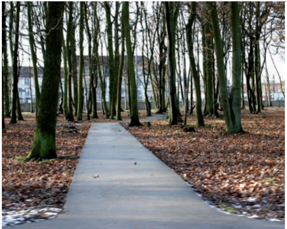
Laisser à l'abandon pendant plusieurs années, le sous-bois a été nettoyé en 2009 à la demande expresse de la municipalité.

Ce volet nécessite la participation de l'ensemble de nos partenaires :