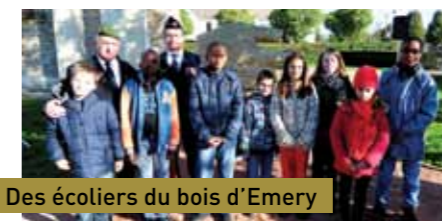
Des écoliers du bois d'Emery

Pour toutes ces raisons, et bien d'autres, la Première guerre mondiale a marqué les esprits de toutes les nations qui ont envoyé des soldats se battre. Les populations n'ont pas oublié les horreurs de cette guerre. Malgré la disparition des derniers Poilus, nombreux sont ceux qui se rendent devant les