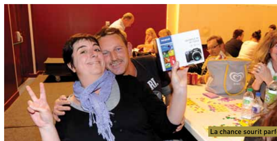
La chance sourit parfois

Chaque fois le scénario est le même. Le soir de loto, les joueurs sont toujours plus nombreux à se presser à l'entrée. Celui organisé par la Mairie ne fait pas exception. Ils ont été plusieurs centaines à tenter leur chance. Concentrés devant leurs cartons, les amateurs de loto espéraient à chaque annonce de numéro que leurs lignes ou leur carton soient les bons. Les chanceux ont été nombreux et, certains sont repartis avec des lots très intéressants.