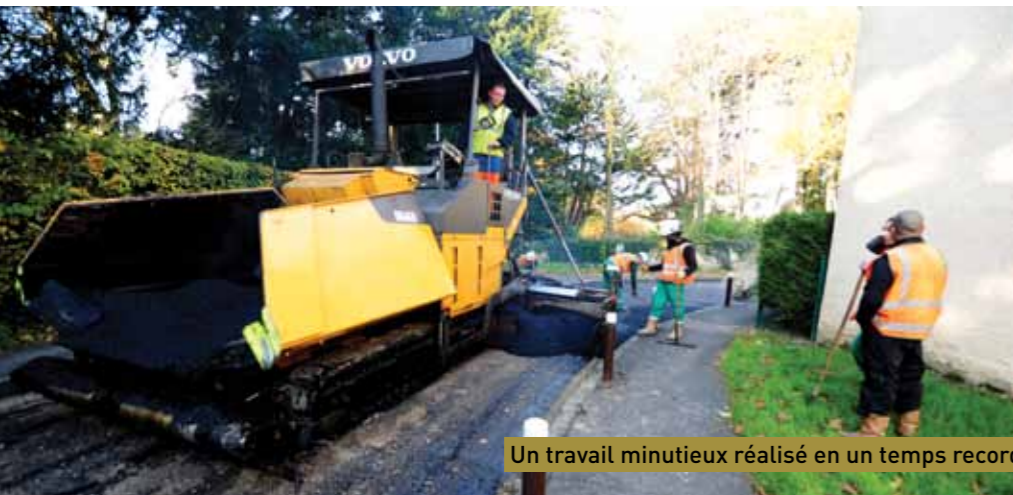
Un travail minutieux réalisé en un temps record