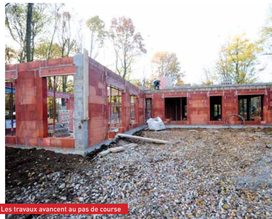
Les travaux avancent au pas de course

Véritable espace de vie, ce lieu devrait devenir rapidement incontournable pour les familles qui y découvriront non seulement un soutien moral mais également de nombreuses activités.