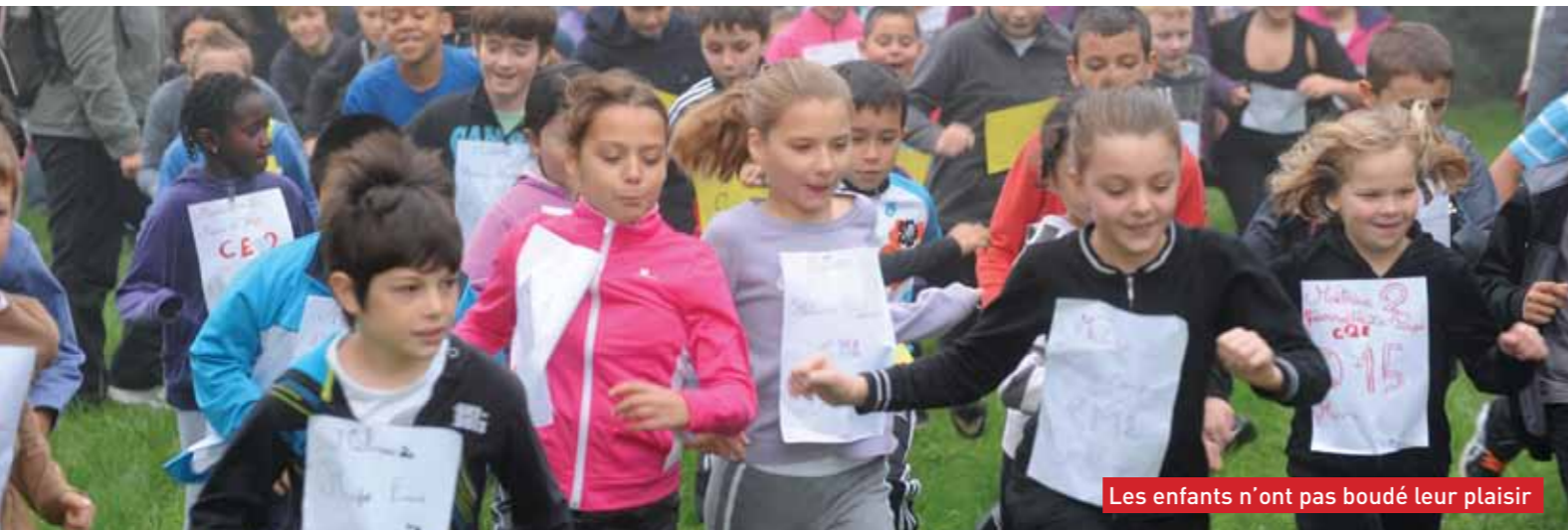
Les enfants n'ont pas boudé leur plaisir

A lors que le brouillard peinait à se lever en cette mi-octobre, les premiers bataillons d'écoliers d'Émerainville et de Croissy-Beaubourg prenaient possession des alentours des étangs de Malnoue. Après plusieurs semaines d'un entraînement intensif avec leurs