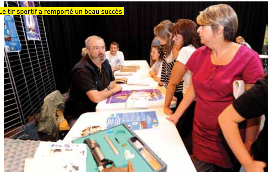
Le tir sportif a remporté un beau succès

diverses associations de la commune. Sport ou culture? Chacun a pu faire son choix et repartir après son inscription. Foot, tir, théâtre, école du cirque, tennis, musique, cuisine, zumba.. Tout le monde a désormais son emploi du temps pour les mois à venir.